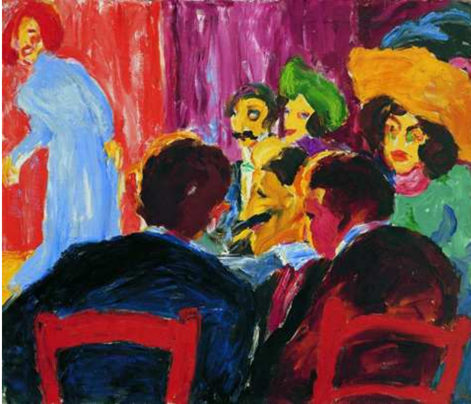
Spectateurs au cabaret - 1911 Huile sur toile 86 x 99 cm Stiftung Seebüll Ada und Emil Nolde Neukirchen, Allemagne