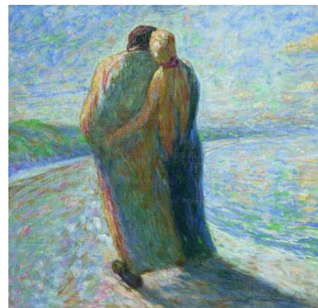
Couple sur la plage (détail) - 1903 Huile sur toile 73,5 x 88,5 cm Stiftung Seebüll Ada und Emil Nolde Neukirchen, Allemagne

La reconnaissance internationale ne tarde pas après-guerre, et Nolde est consacré de son vivant comme l'un des artistes les plus importants de notre temps.