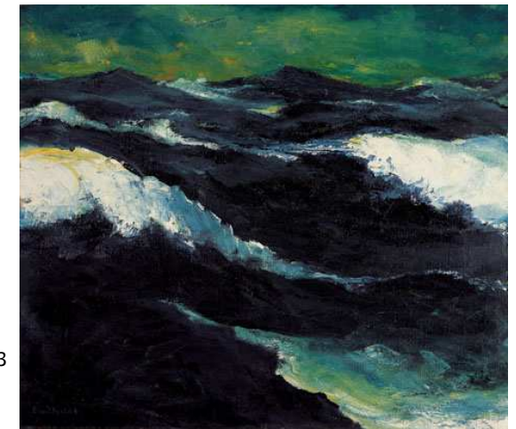
La mer III (Das Meer III) 1913 © Stiftung Seebüll Ada und Emil Nolde - Neukirchen, Allemagne