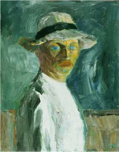
Autoportrait – 1917 Huile sur contreplaqué Stiftung Seebüll Ada und Emil Nolde Neukirchen, Allemagne

1867-1884 : Emil Hansen naît le 7 août 1867 dans une famille de paysans, dans le village allemand de Nolde, près de la frontière danoise. Il prendra pour patronyme le nom de son village natal en 1902, après son mariage. Membre d'une famille nombreuse marquée par une religiosité teintée de paganisme, il fréquente l'école communale et les cours de catéchisme protestant, tout en participant aux travaux agricoles.