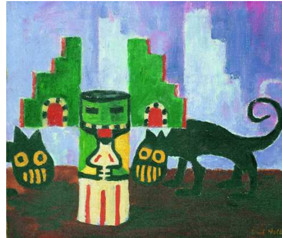
Figures exotiques II - 1911 Huile sur toile 65,5 x 78 cm Stiftung Seebüll Ada und Emil Nolde Neukirchen, Allemagne

Nolde qui pensait incarner l'esprit allemand dans la peinture moderne, fut cependant fort maltraité lors de l'arrivée des nazis au pouvoir. Son adhésion au Parti national socialiste en 1934, ne lui épargna pas d'être