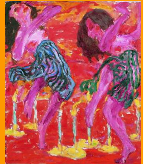
Danseuses aux bougies - 1912 © Nolde Stiftung-Seebüll