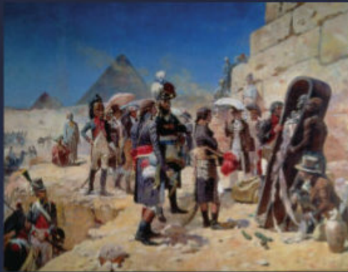
Maurice Orange : Bonaparte devant les pyramides contemplant la momie d'un roi, vers 1890, 390x490 cm, collection musée d'Art et d'Histoire de Granville