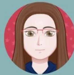
Mayrine Secteur Bibliothèques de quartier