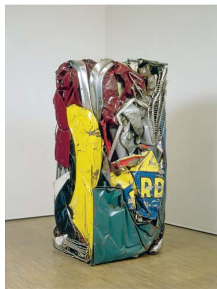
César Compression Ricard, 1962 Compression d'automobile Ricard, 153 x 73 x 65 cm MNAM, Paris © ADAGP, Paris 2007