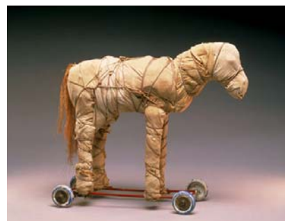
Christo Cheval jouet empaqueté, 1963 40,6 x 50,8 x 12,7 cm Collection Monsieur et Madame Jan van der Marck © Christo, 1963

Christo / Marina Vaizey Albin Michel, 1990 (Les Grands maîtres de l'art contemporain) ART 709.040 7 CHR