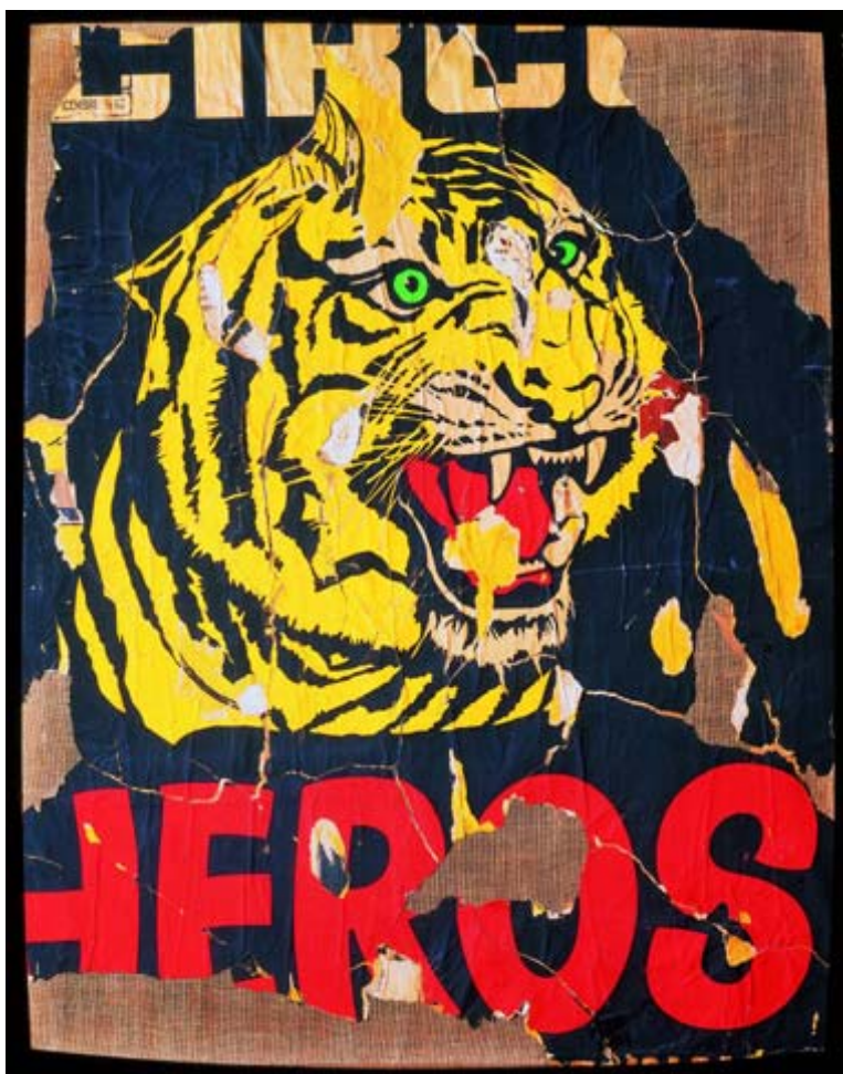
Mimmo Rotella Le Tigre, 1962 Affiche lacérée 110 x 85 cm Fondation Rotella, Milan © ADAGP, Paris 2007

Médiathèque J. Baume 15-21 boulevard Foch 92500 Rueil-Malmaison Téléphone : 01 47 14 54 54 www.mediatheque-rueilmalmaison.fr