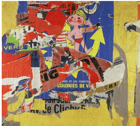
Jacques Villeglé Rue Lauzin, 5 février 1964. Affiches lacérées marouflées sur toile, 210 x 230 cm. Collection privée, Grèce.

L'exposition, d'environ 180 numéros, propose de retrouver la vitalité des actions et des œuvres du « nouveau réalisme » grâce à la reconstitution ou la présentation de certains ensembles et la mise en place d'un parcours thématique et historique permettant de saisir les apports et les spécificités de ce mouvement, ainsi que les temps forts de leur histoire commune. Elle se concentre sur une décennie - de 1958 aux années 1965/69 - qui voit la constitution du groupe et l'expression d'actions collectives - période extrêmement dense et vivante, ensuite recouverte par l'affirmation de trajets personnels.